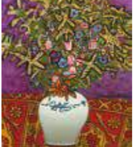
児島善三郎(ミモザその他) 1957年 久留米市美術館蔵

九州洋画の体系的コレクション形成にむけて作品収集を続けている久留米市美術館で、作品収集が現在進行形である、という意味を込めた「コレクションing」展を開催中!第2弾となる今回は、初のお披露目となるコレクションや石橋財団からの寄託作品のほか、修復や額装といった美術館活動の一部も紹介。収集した後も続く「コレクションing」をお楽しみください。