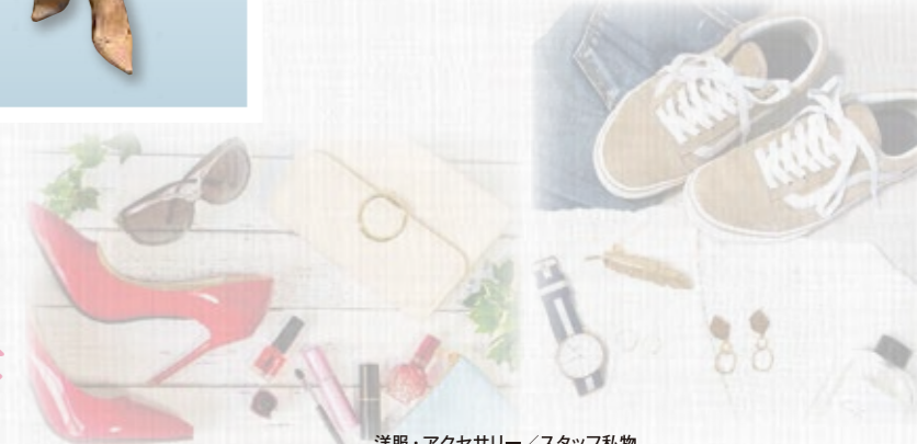
洋服・アクセサリ/スタッフ私物 バッグ・ストール・アクセサリ/SKIPファッション倶楽部