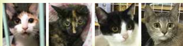
女の子 女の子 女の子 女の子

6カ月の子猫です。元気はつらつの子猫たちの里親さんを募集します。猫に慣れている優しい家族の方を。癒しの力を発揮する子猫と暮らしてみたいか?最後まで家族の一員として迎えてくれる方をお願いします。もちろん、医療費がかかっても大丈夫な経済力のある方をお願いします。