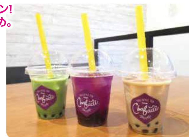
右からミルクティー430円、ブルーティー400円、グリーンティー400円(税別) パタフライピーというハーブを使ったブルーティーは、最初はブルーなのに、レモンの果汁を入れると写真のような赤紫に。レモネードのような甘酸っぱく爽やかな味わいです。

Chabadi (チャバディ) 福岡市中央区大名1-3-52 ARK紺屋町横丁103号 tel 080-4287-7701 (営)日~木11:00~20:00、金土祝前日11:00~23:00 (休)なし