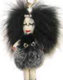
提供 / SKIPファッション倶楽部 福岡市中央区大手門2-2-5 https://skipshop.thebase.in

「SKIPファッション倶楽部」は、SKIP編集者の目でセレクトしたファッションアイテムを揃えるショップ。スワロフスキー付き本革バッグをはじめ、デコバッグや個性的なアクセサリーなど、「大人可愛い」スタイルを提案しています。今回はイムズ出店を記念して、ファードールチャームをプレゼント。ふわふわのファーと個性的なデザインは、大人の女性にもピッタリです!