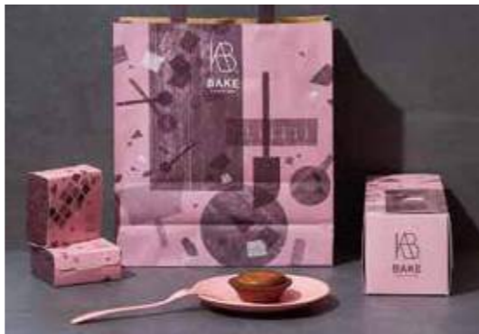
BAKE CHEESE TART (ベイク チーズタルト) 福岡市中央区天神2丁目 天神地下街東4番街 tel 092-791-1383 (営)9:00~21:00