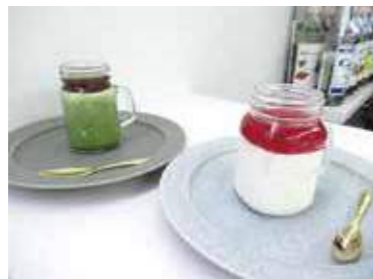
ボトルのレアチーズケーキ(ストロベリー)、 抹茶プリン 各450円(税込)